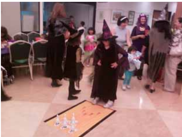
Primero los niños tuvieron sus juegos de Halloween y resultó mucho mejor que ir de puerta en puerta. Los niños se divertieron muchísimo.