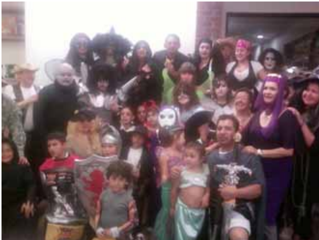
No podía faltar la foto general con todos los disfrazados grandes y chicos. Vemos al DJ vestido de Espartaco Romano. Nos animó para el gran baile que fue un éxito.