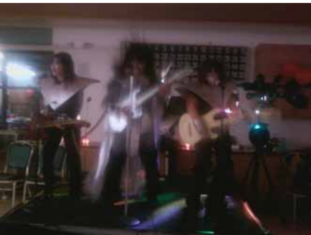
Un grupo de los asistentes estuvo disfrazado de la banda KISS con todos sus integrantes y con sus guitarras eléctricas. En complot con el JD, hicieron su concierto y un show espectacular.