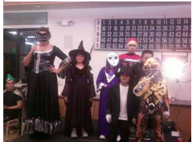
Aquí los finalistas del concurso de disfraces de los niños