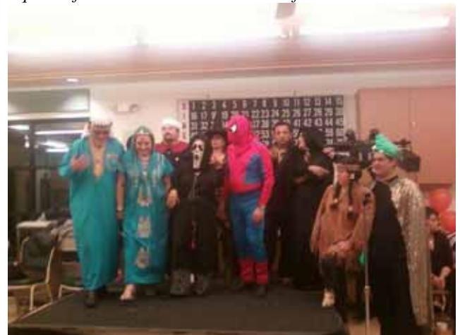
Los participantes en el concurso de disfraces de los adultos.